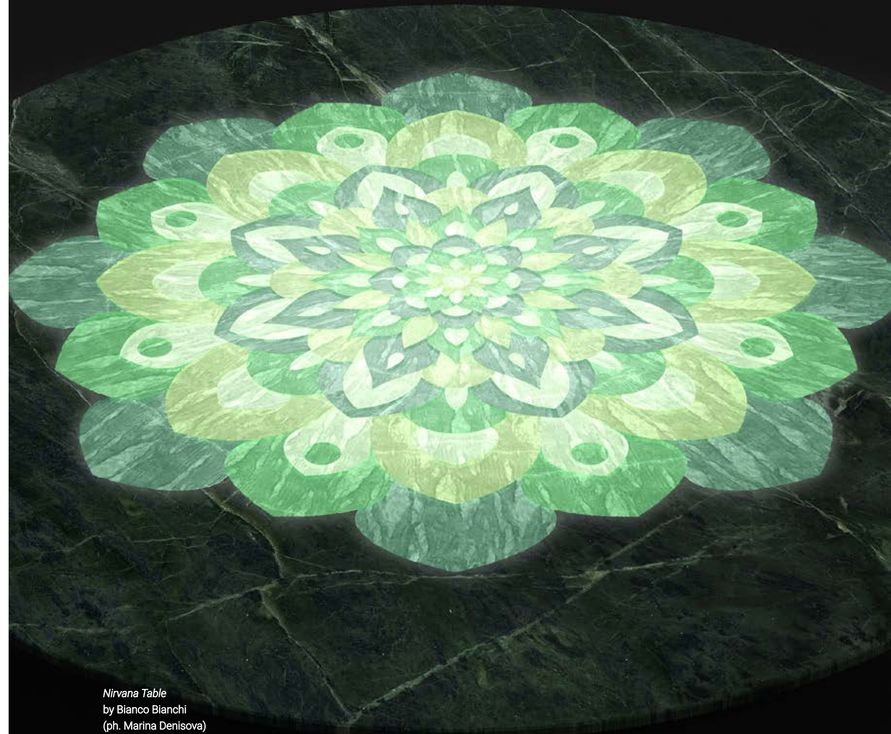
Nirvana Table by Bianco Bianchi